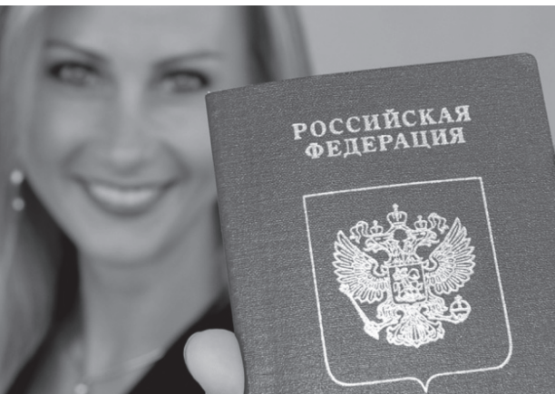
Удалось добиться смягчения закона о прописке - теперь он не касается близких родственников.