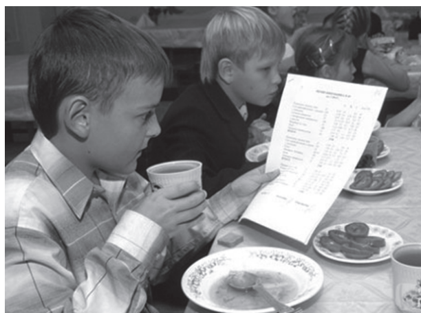
Благодаря нашей настойчивости удалось сохранить бесплатное питание для школьников из малообеспеченных семей.