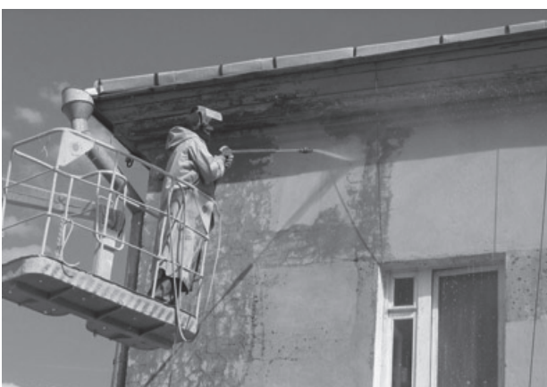
Приняты все наши поправки в закон о капремонте домов - он стал самым удобным и дружелюбным в России.